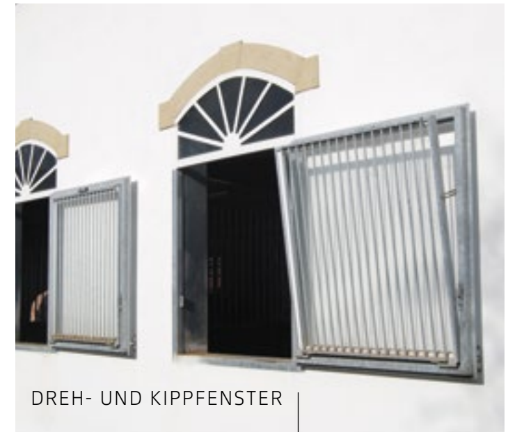
DREH- UND KIPPFENSTER

Ein in den Drehflügel eingebauter Kippflügel ermöglicht auch in den kalten Wintermonaten die Frischluftzufuhr.