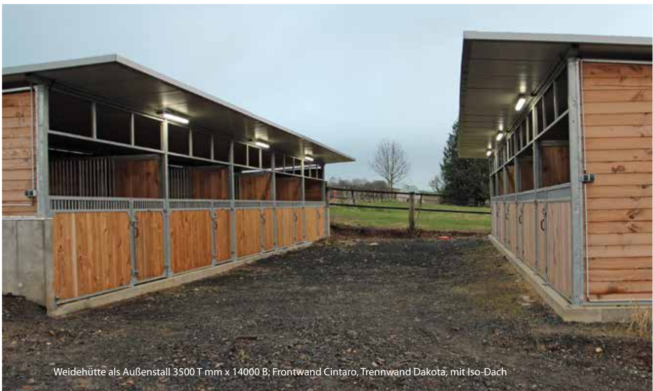
Weidehütte als Außenstall 3500 T mm x 14000 B; Frontwand Cintaro, Trennwand Dakota, mit Iso-Dach

Growi® Weidehütte 3500 x 10500 mm komplett mit 3 Frontwänden Nr. 1435 16.294,00 2 Trennwänden Nr. 1436