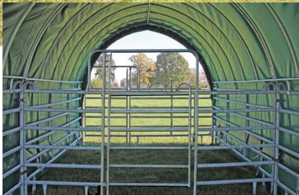
Abbildung mit Tor mittig