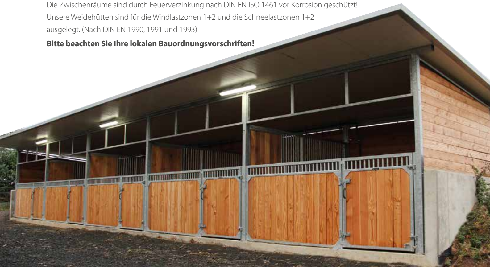
Weidehütte als Außenstall 3500 T mm x 14000 B; Frontwand Cintaro, Trennwand Dakota, mit Iso-Dach

Bitte beachten Sie Ihre lokalen Bauordnungsvorschriften!