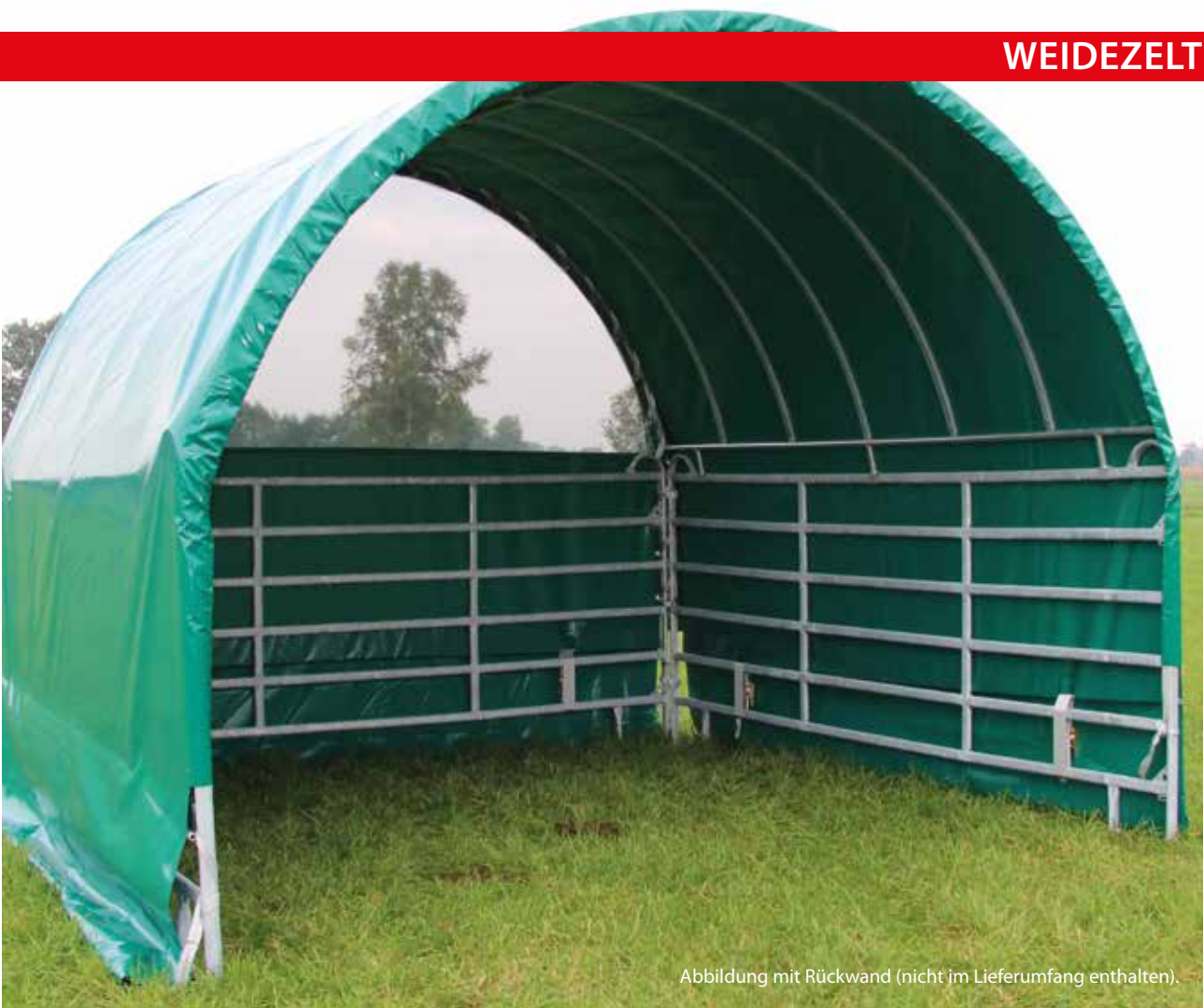
Abbildung mit Rückwand (nicht im Lieferumfang enthalten).