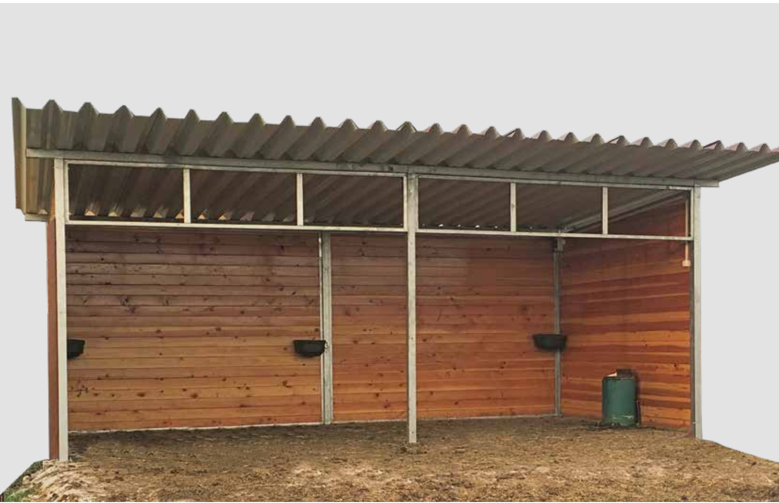
Bild oben: Weidehütte 3500 T x 7000 B mm; Bild unten: Weidehütte 3500 T x 14000 B mm