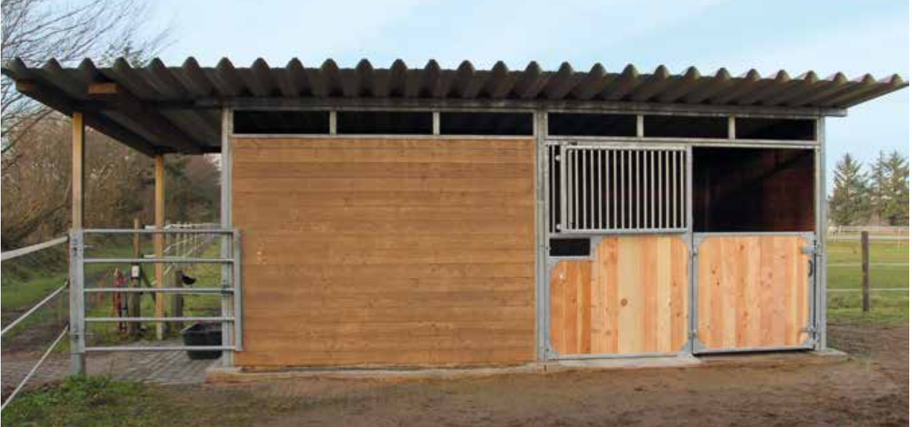
Weidehütte als Außenstall, 7000 B x 3500 T mm, Frontwand Evando, zweiteilig.