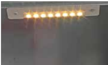
Beleuchtung mit Bewegungsmelder zum Ankleben