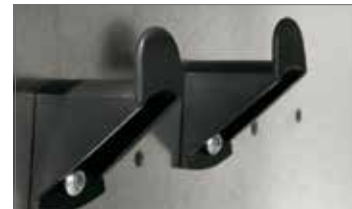
Verstellbare Einlegeböden mit jeweils 2 Universalhaken