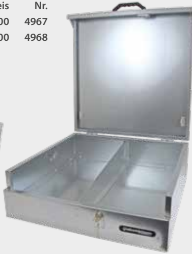
Abbildung Aufsatzschrank mit fahrbarem Sattelschrank Nr. 5178 (s. S. 176)