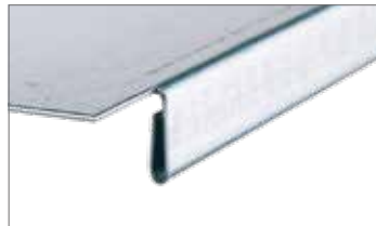
Doppelt umgelegte Kanten, stabil und ohne scharfe Kanten