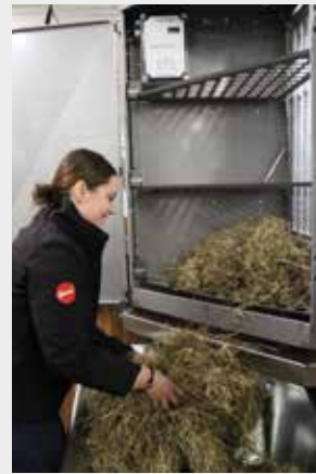
Bequem und einfach zu Befüllen: in der Box oder von der Stallgasse