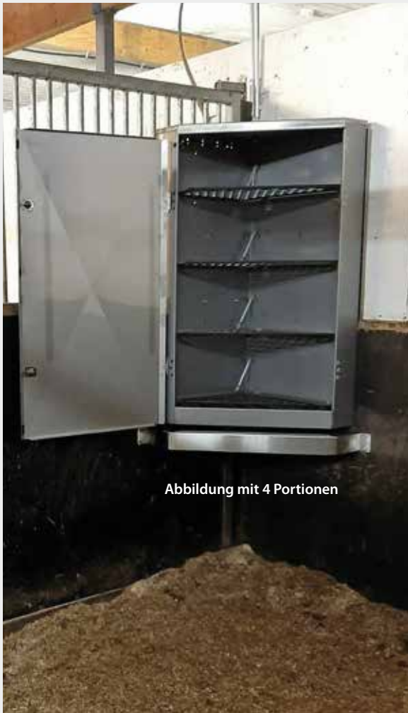
Abbildung mit 4 Portionen