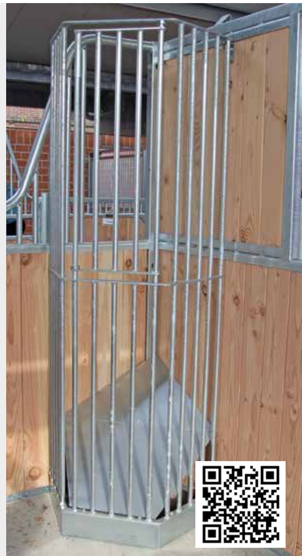
QR-Code zum Produktfilm auf unserem YouTube-Kanal

Im zweiten Fall wurde die Heuraufe an die Rückwand einer Außenbox montiert, da an der Frontseite Tränke und Futterkrippe angebracht sind. Das Dressurpferd soll sich möglichst lange mit der Heuaufnahme beschäftigen. Auch hier wurde die Raufe von dem Pferd sofort akzeptiert. Dieses Pferd dreht den Hals nur geringfügig, um an das Heu zu gelangen. Der Stababstand ermöglicht ein Herauszipfen des Heus, eine Verteilung in der Box findet nicht statt. Der Pferdebesitzer ist mit der Raufe zufrieden. (...)