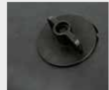
Auslaufstopfen für den Growi®Profi-Futtertrog