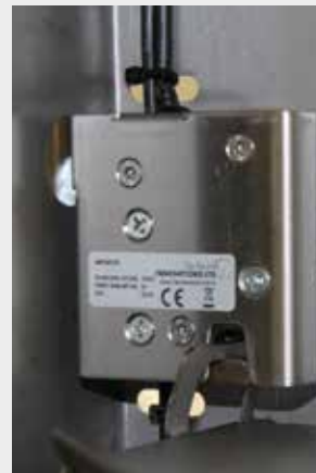
Die Steuereinheit löst die Verriegelung der Heuebene und das Futter fällt nach unten

Einfach zu Bedienen: Heuebene befüllen und Zeiten einstellen