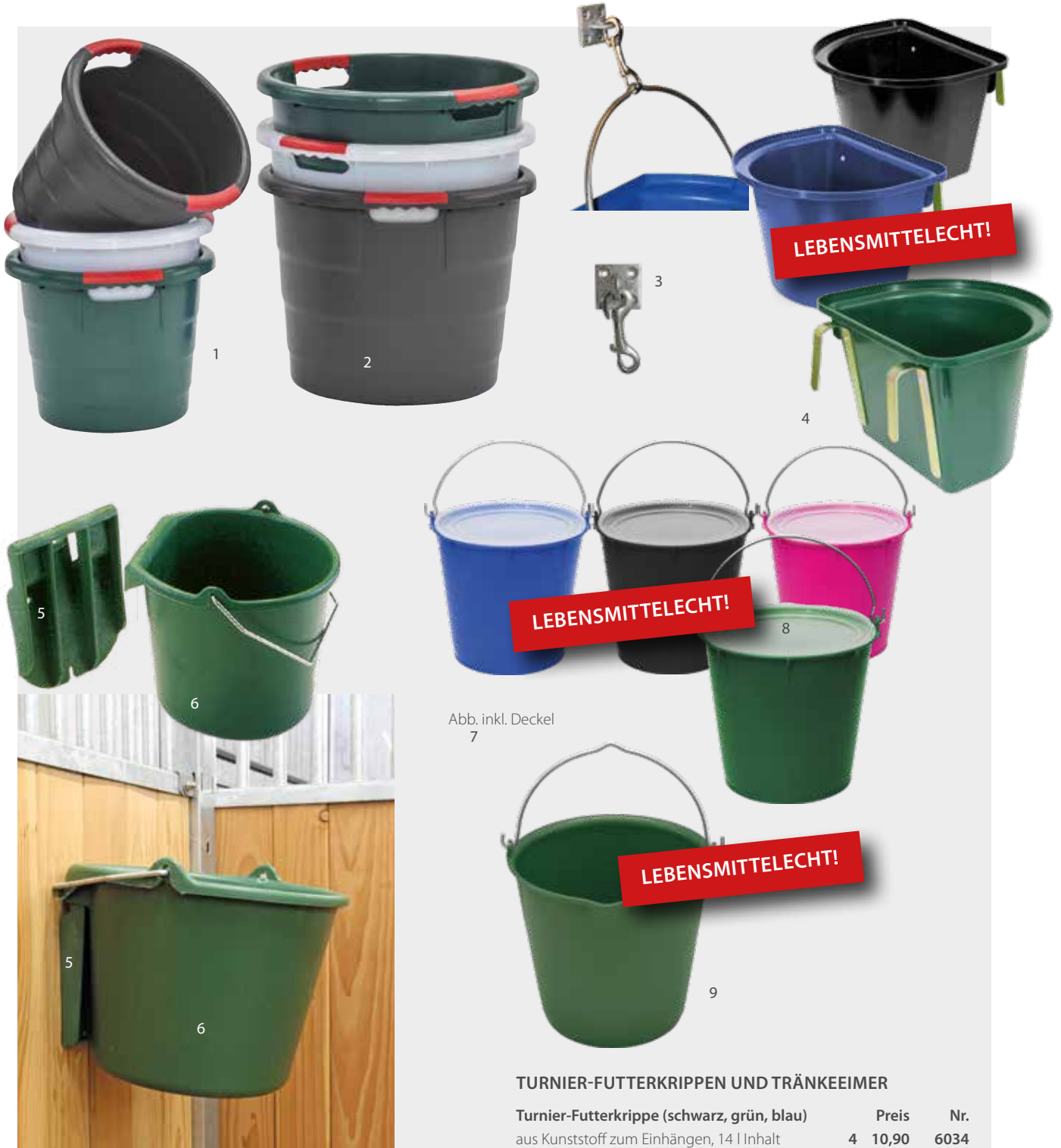
Abb. inkl. Deckel 7