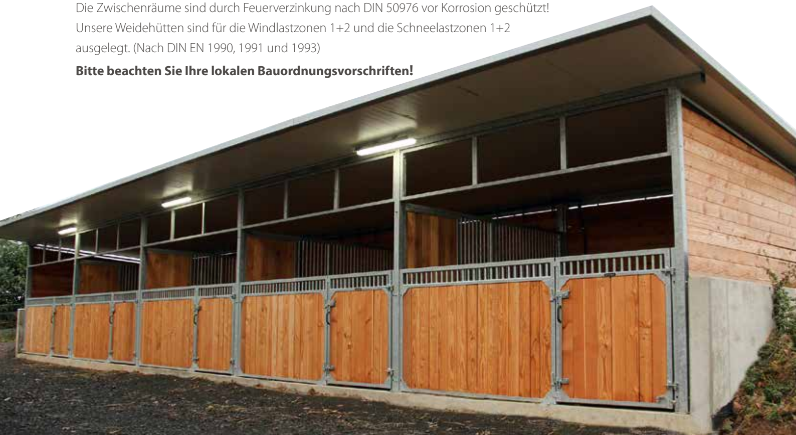
Weidehütte als Außenstall 3500 T mm x 14000 B; Frontwand Cintaro, Trennwand Dakota, mit Iso-Dach

Bitte beachten Sie Ihre lokalen Bauordnungsvorschriften!