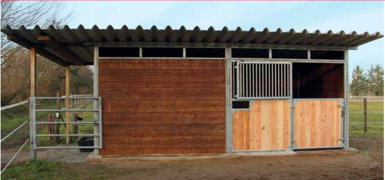
Weidehütte als Außenstall, 7000 B x 3500 T mm, Frontwand Evando, zweiteilig.