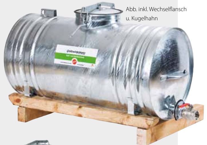
Abb. inkl. Wechselflansch u. Kugelhahn